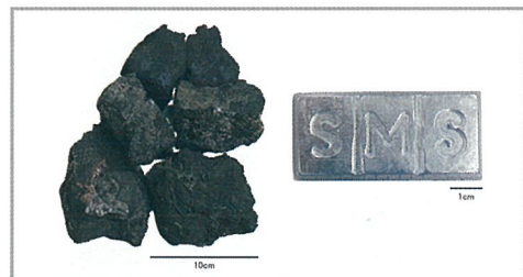
海底熱水鉱床の鉱石(左)と製錬所で製造した亜鉛地金(右)

海洋資源の調査・研究は実証実験の段階に入り、沖縄周辺深海底の海底熱水鉱床鉱石から亜鉛地金を製造することに成功しています。海底鉱物資源の開発など、海を舞台にした新しい産業への取り組みは、沖縄県内でも進んでいます。最新の状況や今後の課題を皆様にご報告します。