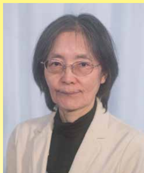
弁護士 東京経済大学教授