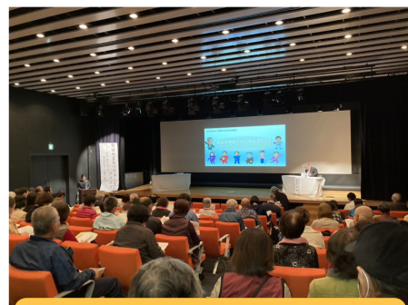
なはみまもりフォーラム2023

今回は『人を知る 冒険に出かけよう！』をテーマに、 「なぜ人とのつながりが必要なのか？」「気に掛け合う 関係性の大切さ」などを会場の皆様と考えていきます。 地域にあるゆるやかなつながりの中で、誰かに少しの関 心を持つことで、新しい発見やつながりが生まれます。 ぜひ一緒に人を知る 冒険に出かけましょう！